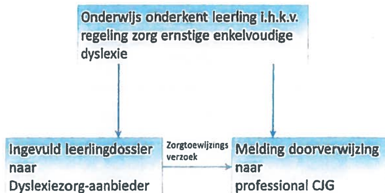
Figuur 2: Verwijzen/melden.